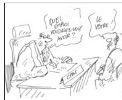
Dessin de Serdu :La dignité... parlons-en ! édité par Luc Pire

« On ne vas pas au CPAS pour qu'il nous prenne en charge. On y va pour avoir les moyens de se prendre en charge». p 83