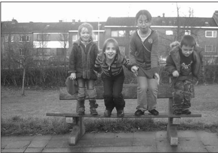
S comme SAUTER