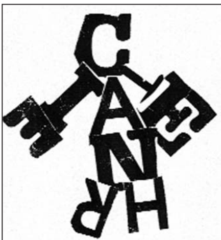
Catherine a fait un bonhomme aux grandes mains

a b c d e f g h i j k l m n o p q r s t u v w x y z a b c d e f g h i j k l m n o p q r s t u v w x y z