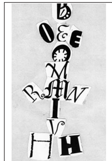
Voici un très vilain bonhomme-hiver!

a b c d e f g h i j k l m n o p q r s t u v w x y z a b c d e f g h i j k l m n o p q r s t u v w x y z