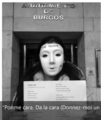
"Ponme cara. Da la cara (Donnez-moi un visage.) en Espagne