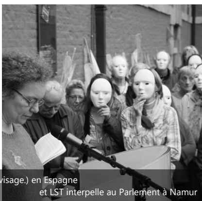
et LST interpele au Parlement à Namur

Un groupe de personnes venus d'Espagne nous a partagé leurs luttes avec des personnes qui vivent à la rue dans la région de Burgos. Une des actions qu'ils ont menées nous a frappés.