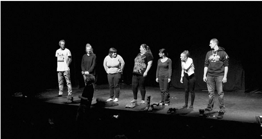
PLATE FORME PAUVRETÉ DES ENFANTS ET DE LEURS FAMILLES

Après avoir osé monter sur les planches avec la création théâtrale « Du gravier dans les chaussures », nait l'idée de prolonger la diffusion de ces messages forts par un outil vidéo. Une nouvelle aventure dans la découverte du 7ème art tant dans le processus de création que des différentes techniques cinématographiques. En attendant la production finale, découvrez la bande annonce. ( http://www.mouvement-lst.org/videos.html ou http://www.mouvement-lst.org/lstj_andenne_activites.html ).