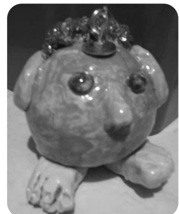
Réalisation de l'atelier terre 2017 – CEC LST Andenne

Je vis bien ! Je n'ai pas à me plaindre ! Je vis !