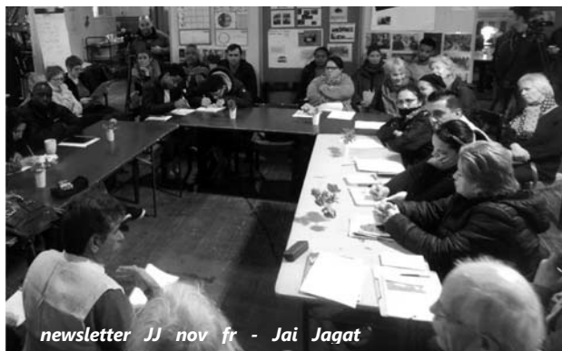
newsletter JJ nov fr - Jai Jagat

C'est important de mobiliser aussi des personnes et des familles qui sont forcées de vivre « cachées, invisibles » dans ce pays qui abrite autant des symboles de l'accumulation des richesses, que les organisations de défense des droits humains. En voyant la photo d'une rencontre à Genève on se rend compte que c'est « comme chez nous ».