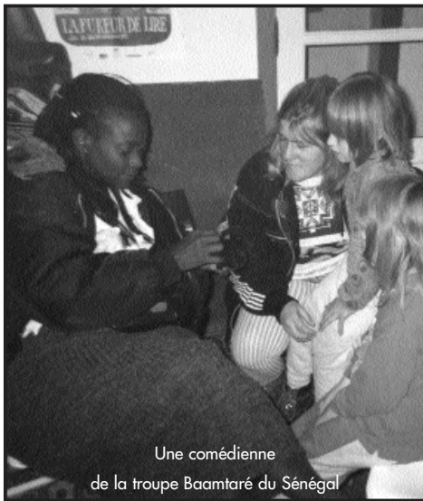
Une comédienne de la troupe Baamtaré du Sénégal

Charlotte pense qu'une première chose à faire pour réduire la grande