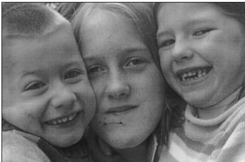
Les enfants de la photo n'ont rien à voir avec l'article